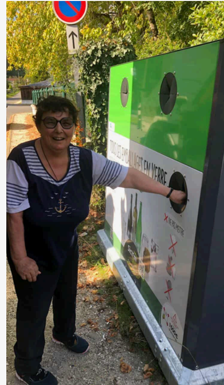
Des colonnes équipées de trappes PMR, adaptées pour tous